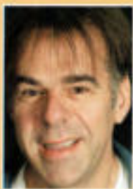
Paziente: ripristino dell'estetica frontale e laterale